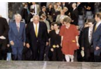
Feierlichkeiten anlässlich des 150. Geburtstages der „Innere Mission und Diakonie 1848-1998“