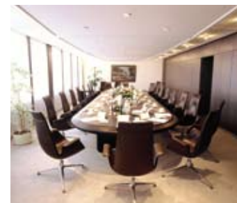
Sitzungssaal in Sophienblatt 78