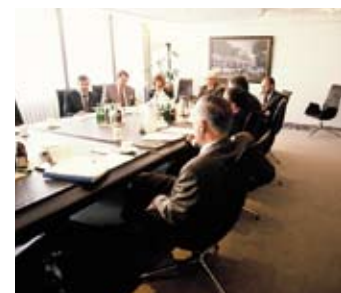
Sitzung des Vorstandes in dem großem Sitzungssaal