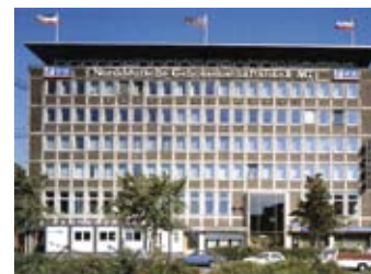
Es begann 1968 im Raiffeisenhaus