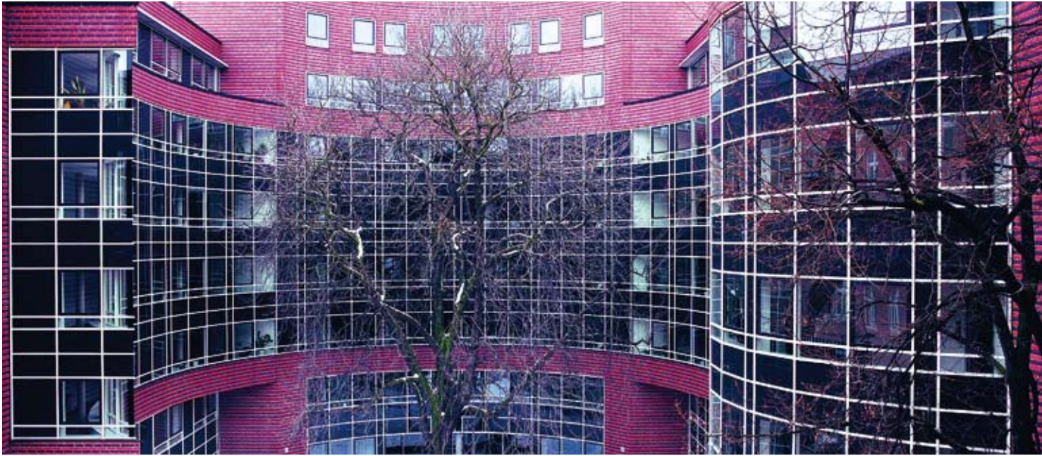
Am 1. Februar 2002 fand der Umzug der Filiale Berlin in die Räumlichkeiten des Evangelischen Zentrums in der Georgenkirchstr. 69/70 statt.