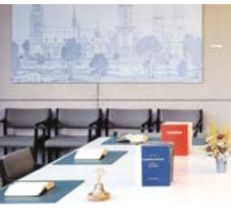
Sitzungssaal Nordelbisches Kirchenamt, Gründung der EDG, 9. Februar 1968