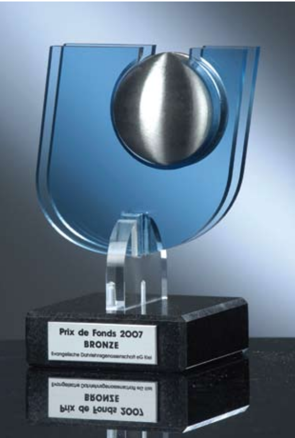
„Prix de Fonds“

Hierzu gehört auch der Wechsel zum Handelsbuchinstitut. Somit hat die EDG seit dem 1. August 2005 die Möglichkeit, mit ihren Eigenanlagen an den Kapitalmärkten flexibler agieren zu können. Die kurzfristigen Ertragschancen konnten seitdem besser genutzt werden.