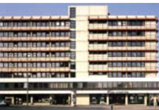
Lange Jahre eine gute Adresse der EDG: Sophienblatt 78